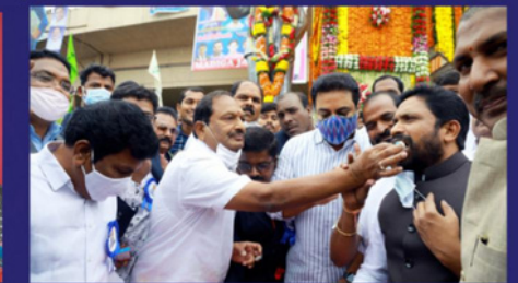
MICCI inauguration on 14th April 2021 at Tank Bund-Hyderbad