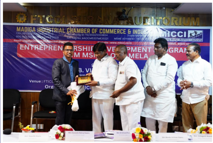
EXIM - Export Import Management on 27 Jan 2024 at FTCCI, Hyderabad