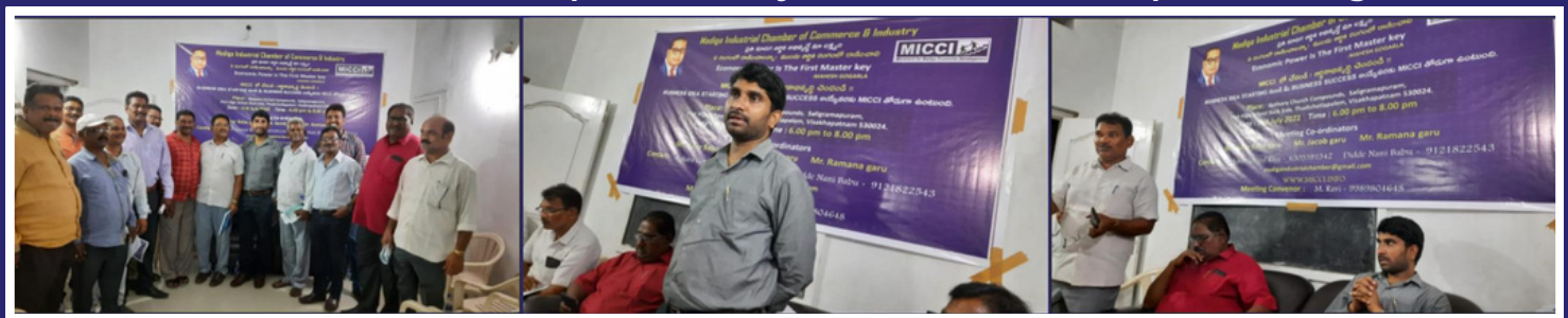
MICCI AP State and District Committee Formation on - RoyalFort Hotel