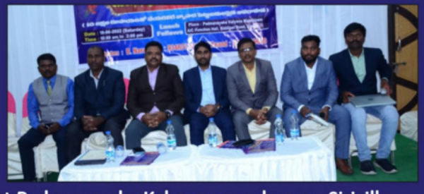
Dailt Bandu awareness program on 18° June 2022 at Padmanayaka Kalyana mandapam- Siricilla