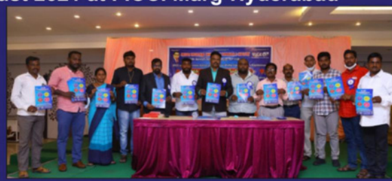
Dailt Bandu awareness program on 21 august 2021 at Hotel Nikhil sai Internation-Nizambad